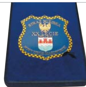
RADNY WŁODZIMIERZ OLEKSIAK PROMUJE MIASTO NOWY DWÓR MAZOWIECKI PODCZAS POBYTU NA KASZUBACH. WRĘCZYŁ KRZYSZTOFOWI KRAWCZYKOWI PAMIĄTKOWY RYNGRAF Z OKAZJI 20-LECIA STRAŻY MIEJSKIEJ W NOWYM DWORZE MAZOWIECKIM.