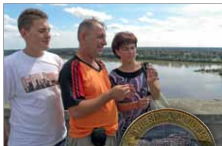
A FUNTEM CIESZA SIE JUZ TURYSKI ODWIEDZAJACY TWIERDZĘ MODLIN.

PozaTaekwondo zajmuję się: Studiowaniem Mongolistyki i Tybetologii oraz interesowaniem się wszystkim co związane z Koreą, z której taekwondo pochodzi.