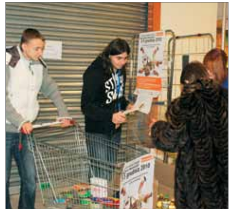
CARREFOUR: MIESZKAŃCY CHĘTNIE WKŁADALI PRODUKTY

To dzięki Waszej otwartości, dyspozycyjności, hojności, odpowiedzialności podczas przebiegu całej akcji Świątecznej Zbiórki Żywności 2010 możemy powtórzyć słowa: los zawodzi, my – nie!