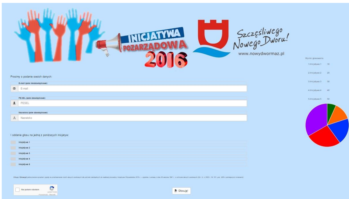
Rys. 5 Komunikat po oddaniu głosu

Oddany głos zostanie sprawdzony w następujących krokach: