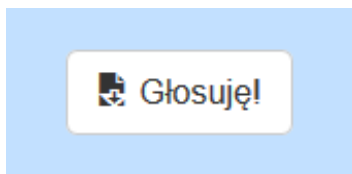
Rys. 4 Przycisk do głosowania

Ostatnim krokiem jest kliknięcie przycisku Głosuję!