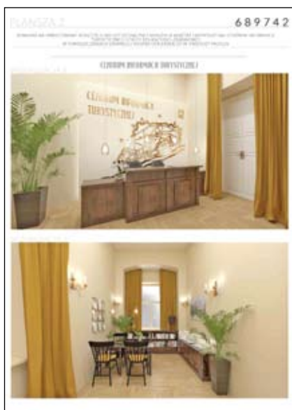
ZWYCIĘSKA PRACA KONKURSOWA NR 689742

Części graficzne wszystkich prac złożonych w konkursie zamieszczamy poniżej w galeriach.