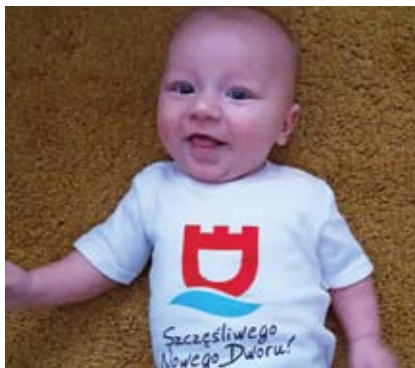
TADEUSZ GRAFKA UR. 5-08

Za zgodą rodziców publikujemy kolejne zdjęcia pociech.