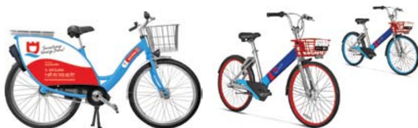
Przykładowe wizualizacje roweru miejskiego

Dworu Mazowieckiego nie tylko poprzez poprawę warunków dla miejskiej mobilności. Władze miasta liczą również na polepszenie jakości powietrza na terenie miasta oraz ograniczenie korków trapiących w godzinach szczytu główne ciągi komunikacyjne miasta.