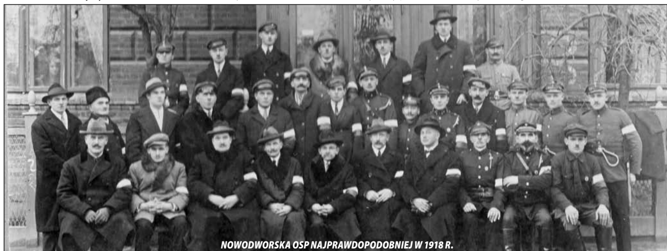
NOWODWORSKA OSP NAJPRAWDOPODOBNIEJ W 1918 R.