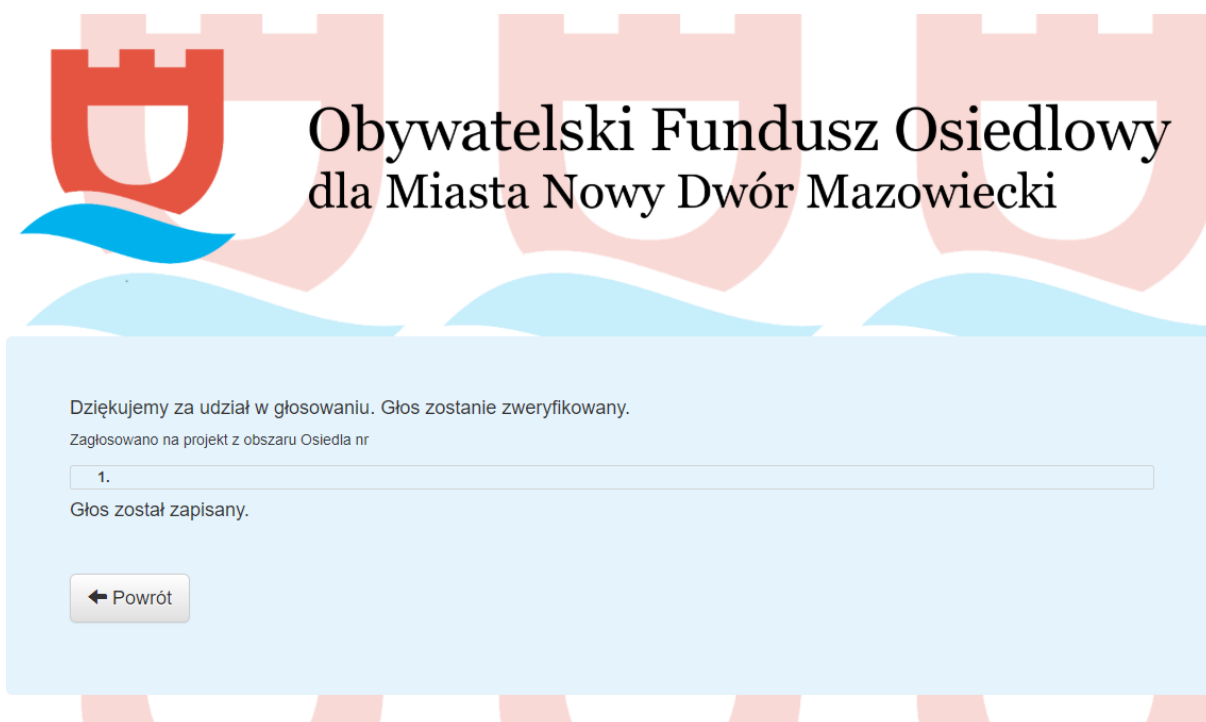
Rys. 5 Komunikat po oddaniu głosu

Jeśli wpisane dane spełnią wymogi pól formularza (jedenastocyfrowy numer pesel oraz wypełnione pole nazwisko), to zostanie wyświetlony następujący komunikat: