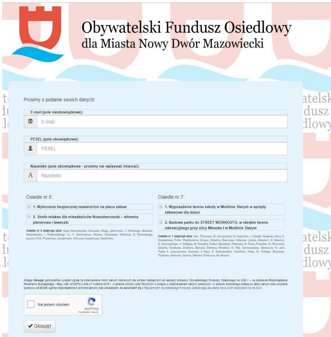
Rys. 1a Formularz do głosowania na stronie www

Po wejściu na stronę głosowania dostępny będzie formularz: