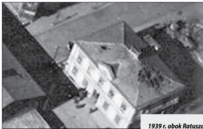
1939 r. obok Ratusza nie ma dobudówek